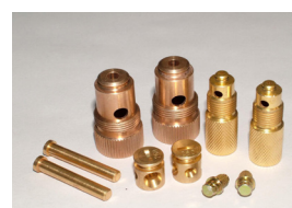
卫浴、光学、仪器仪表车铣、径向打孔等等