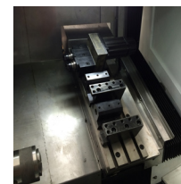
Z 向双头动力头加刀座