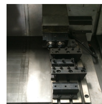
X 向双头动力头加刀座