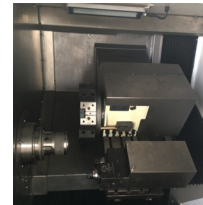
刀塔带双头动力头