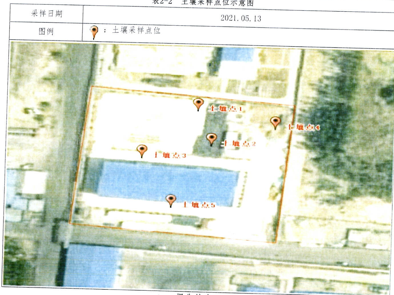
表2-2 土壤采样点位示意图