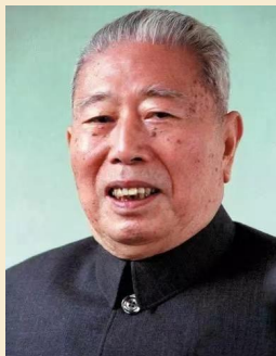
宋任穷 曾担任中共中央政治局常委