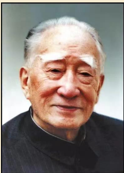
薄一波 曾任中共中央政治局委员