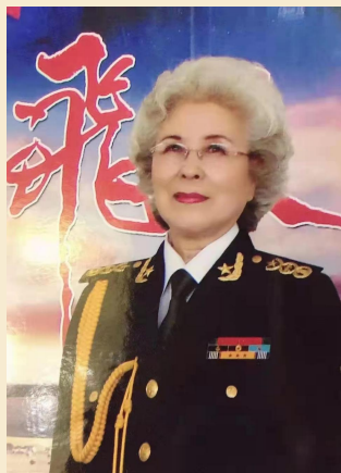
王莉华 女高音歌唱家

总政歌舞团、总政军乐团独唱演员，中国音乐家协会会员。中央人民广播电台、中央电视台多次录制《王莉华独唱专集》；1979年应邀参加中央电视台首次举办的春节文艺晚会；多次在全军和国家级的大型庆典活动中演出，荣立三等功，并长期活跃在祖国大江南北的文艺舞台上