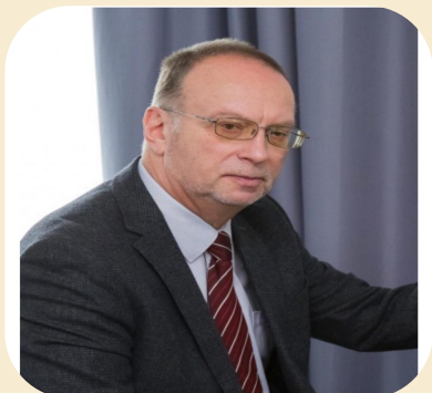
列奥尼特 米哈伊洛维奇

中国著名作曲家、指挥家，中国音乐家协会理事、香港作曲及作词家协会（CASH）主席