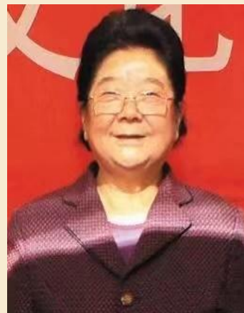
顾秀莲 第十届全国人大副委员长 中国关心下一代工作委员会主任