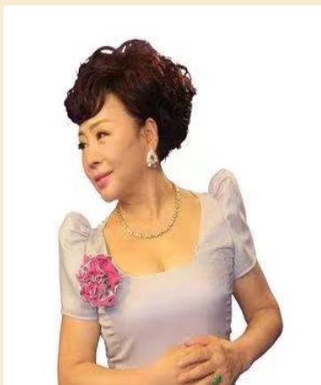
宋丽华 国家一级演员

中国音乐家协会会员，著名女高音歌唱家，全总文工团艺术骨干，经常参加国家和地方文艺演出。2008年北京奥运期间演唱《萨马兰奇，北京欢迎您》，受到时任国际奥委会主席萨马兰奇先生亲切接见。