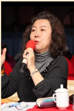
巩素清 国家一级演员

中国歌剧舞剧院买剧团团长助理，女高音声音部长，中国儿童音乐学会秘书长，原来首都联合大学中国歌剧舞剧院分校副校长